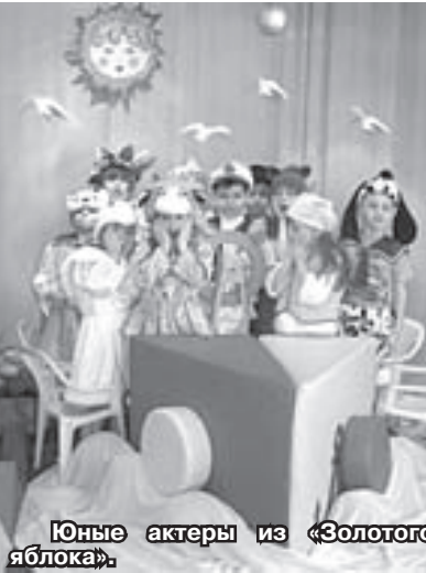
Юные актеры из «Золотого яблока».

«Свое выступление на фестивале мальчишки и девчонки посвятили Году Культуры. Фольклор – источник нравственного, эстетического, трудового, художественного воспитания. В наши дни очень важно приобщение ребят к сокровищнице отечественной культуры и истории, чтобы воспитать любовь к земле, на которой родился и вырос, чувство гордости за свой народ и Родину. Свои музыкальные способности показали ребята, исполнив народные песни в сопровождении и а капелло, а «красны девицы» виртуозно сыграли на ложках. «Барышни» пели шуточные частушки про «кавалеров». Веселье было в полном разгаре, когда все участники и гости закружили в народном круговом танце «Коробейники».