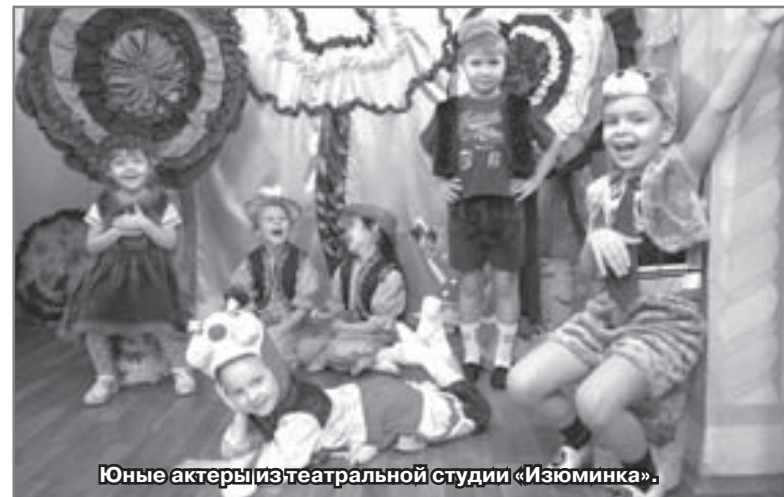
Юные актеры из театральной студии «Изюминка».

Очень приятно, что участие в фестивале «Радужная маска»