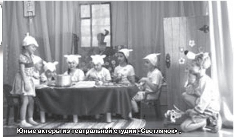
Юные актеры из театральной студии «Светлячок».

«В спектакле ребята, используя образы сказочных персонажей,